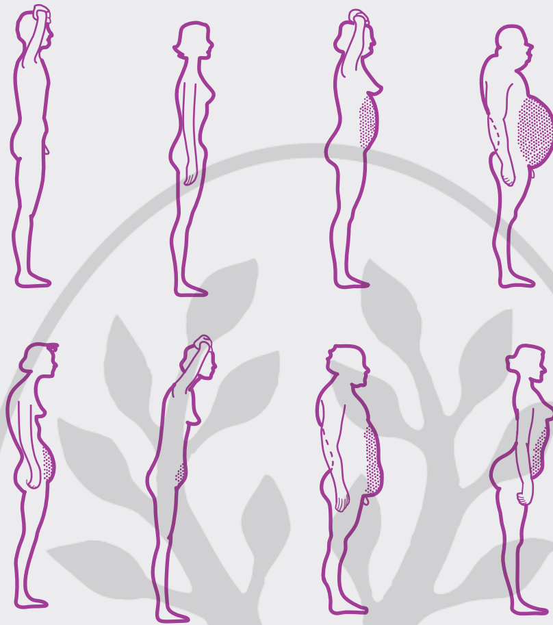
► Abb. 2 Körperhaltungen nach F. X. Mayr: 1) normale Haltung; 2) Habachthaltung; 3) Großtrommelträger; 4) lässige Haltung; 5) Sämannshaltung; 6) Anlaufhaltung; 7) schlaffer Gas-Kotbauch; 8) Entenhaltung Grafik: Rauch E. Darmreinigung. Das Original nach Dr. med. F. X. Mayr. 44. Aufl. Stuttgart: Trias; 2019