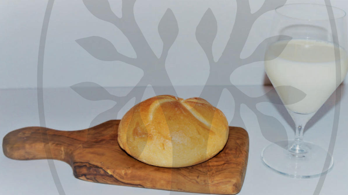
► Abb. 1 Die ursprüngliche initiale Milch- und Semmel-Diät dient der Schonung und Säuberung des Darms. Die Diät wird heute allerdings vielfach abgewandelt.